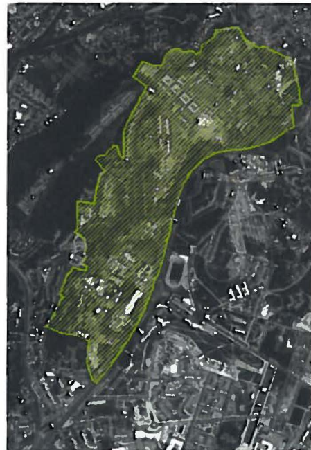
Janeiro 2018 (2ª Proposta de Redelimitação ARU)