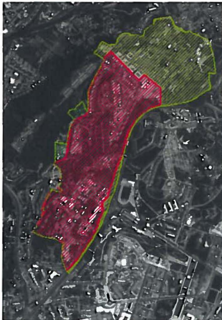
Novembro 2016 (Aprovação da 1ª Redelimitação ARU)