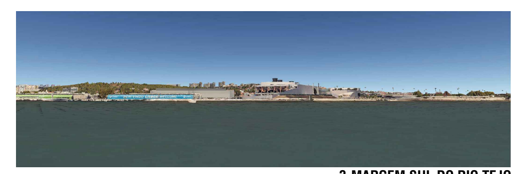
3-MARGEM SUL DO RIO TEJO