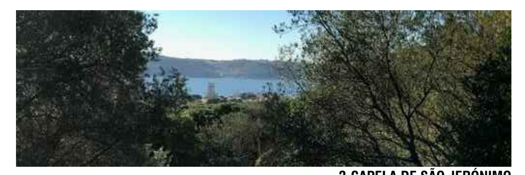
2-CAPELA DE SÃO JERÓNIMO