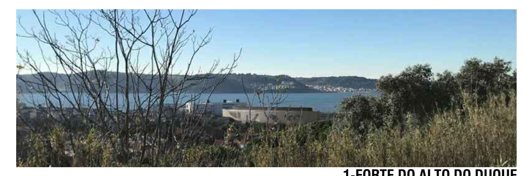
1-FORTE DO ALTO DO DUQUE